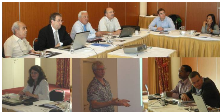
Meeting in Maastricht